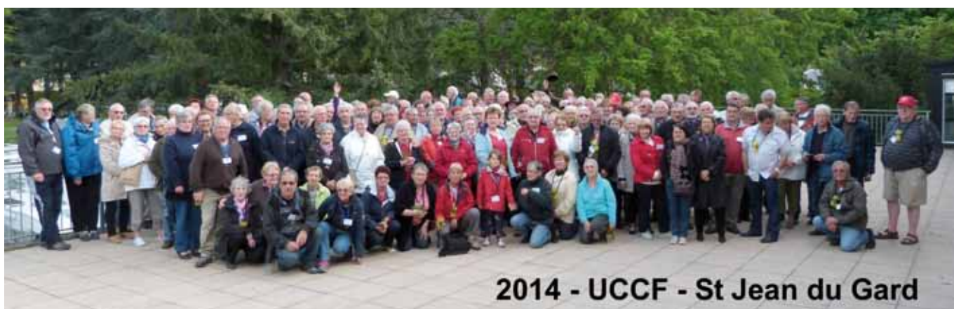
2014 - UCCF - St Jean du Gard