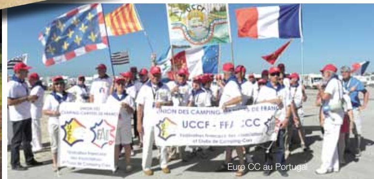
Euro CC au Portugal