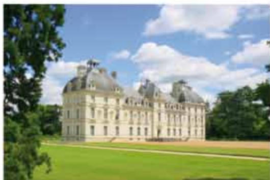
CHEVERNY UN DES PLUS BEAUX