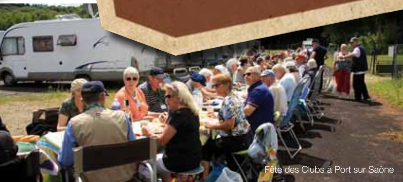
Fête des Clubs à Port sur Saône

Vadrouille en camping-car # septembre 2014