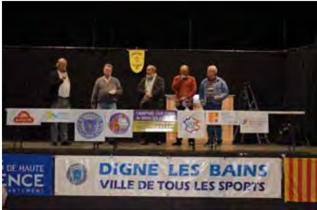
Compte rendu du rassemblement de Camping-cars avec le club de PROVENCE COTE D'AZUR à DIGNE LES BAINS (04).